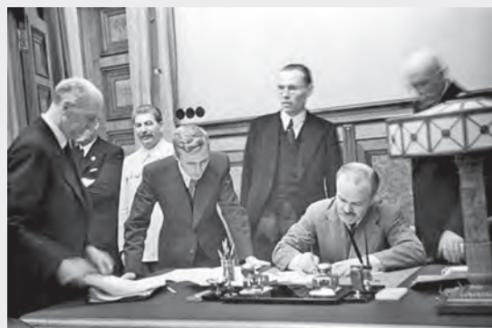
Нарком иностранных дел В. Молотов подписывает Договор о дружбе и границе между СССР и Германией 28 сентября 1939 года.

Сталин же, напротив, всячески хотел затушевать тот факт, что делит Польшу с Гитлером. Он тянул время, считая, что чем больше в этой войне проявится агрессивность нацистов, тем легче будет выдать собственную агрессивность за «освободительный поход». И только тогда, когда вермахт вышел к Белостоку на севере, начал штурмовать Брестскую крепость в центре и получил задачу захватить Львов на юге, когда Варшава держала оборону в глубоком окружении, когда правительство Польши начало переговоры о проезде через румынские порты во Францию, только тогда Красная Армия перешла польскую границу. Тем самым, Советский Союз вступил во Вторую мировую войну.