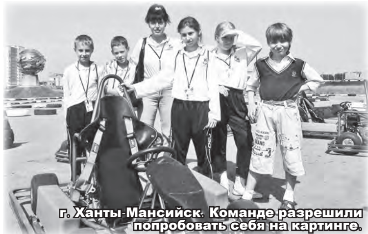
г. Ханты-Мансийск. Команде разрешили попробовать себя на картинге.

На фоне многочисленных конкурсов и заданий интересно было наблюдать за технической дуэлью велосипедистов, которые демонстрировали свои знания об устройстве велосипедов, подтверждая их практическими навыками. Отдельный конкурс под названием «Открытая перемена» был рассчитан на педагогов дополнительного образования, наполняя их поделиться своим опытом. Здесь