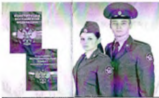
Дело, которому служим!

в ФКУ КП-26 ГУФСИН России по Приморскому краю приглашаются на службу: граждане не моложе 18 и не старше 40 лет