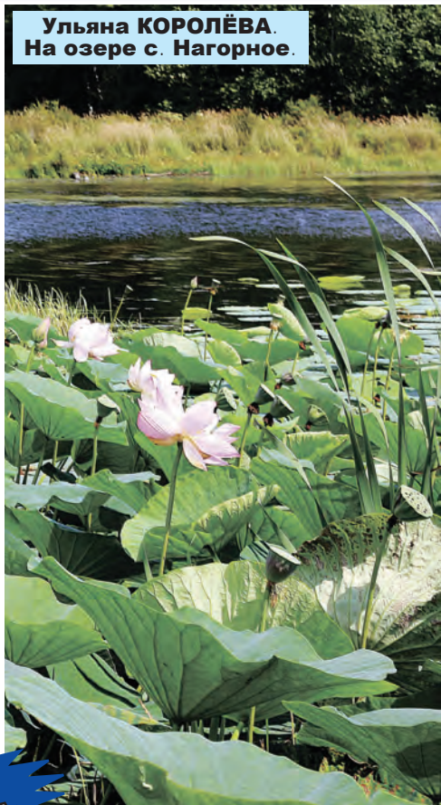
Ульяна КОРОЛЁВА. На озере с. Нагорное.