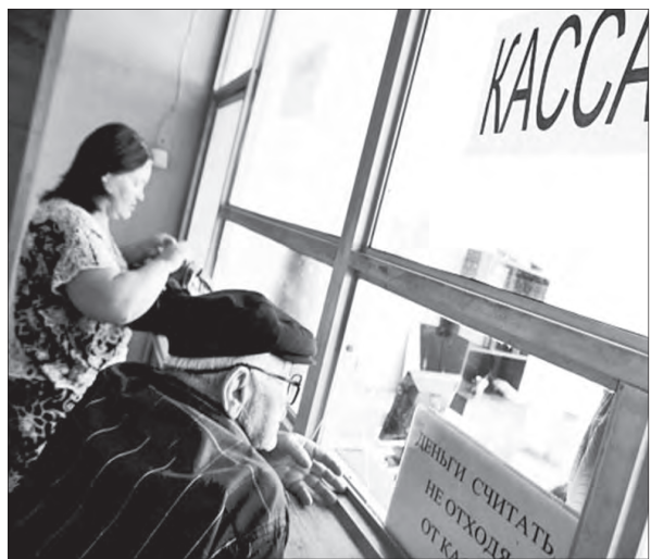
Департамент массовых коммуникаций.

ние дотаций организациям коммунального комплекса на возмещение недополученных доходов в сфере теплоснабжения. Исключение составляют предприятия, находящиеся на территориях, приравненных к районам Крайнего Севера. В Приморском крае изменения коснулись семей, проживающих в муниципальных образованиях, кроме северных районов и практически всего Владивостока. По информации департамента социальной защиты населения, это около 220 тысяч приморских семей.